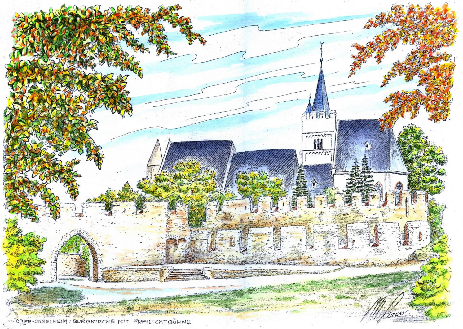
OBER-INGELHEIM / BURGGIRCHE MIT FREILICHTBÜHNE