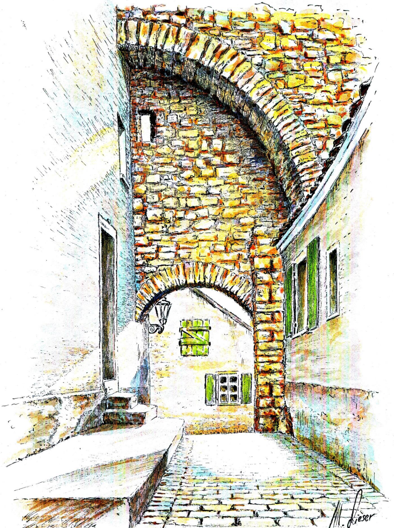
Jügelheim am Rhein / Zuckerbergtor